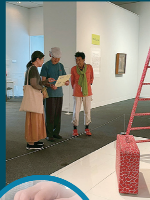
手と目で作品に近づく

2025年7月3日、視覚障害者の鑑賞ガイドプログラムが実施されました。この日の参加者は、視覚障害者1名、介助者1名。それに対し、ガイド担当者2名、オブザーバー1名、職員3名でした。1階のMOMASコレクションより3点、休憩をはさみ、2階講堂でデザイン椅子の鑑賞をしました。