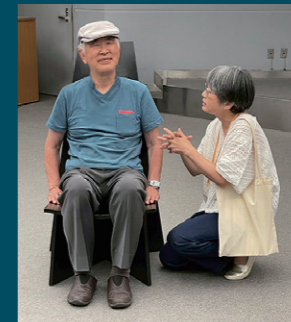
「この椅子、自分の部屋に置きたいな」