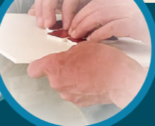
Iさん手作りの草間作品の触図(作品の複製物ではありません)