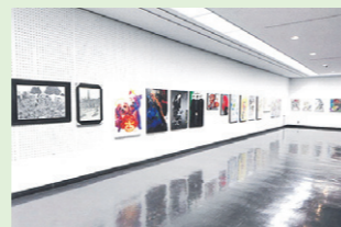
前回のデザイン部の会場風景

二科埼玉支部所属作家の作品発表の場であり、支部主催の公募展、小品展(絵画)に応募された皆様の作品発表の場でもあります。絵画、彫刻、デザイン作品200点展示予定です。多くの皆様の作品の応募を歓迎します。