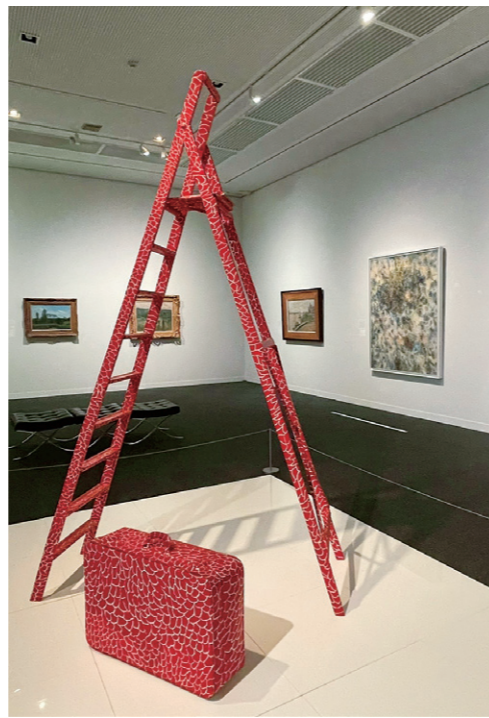
7月3日の常設展示室のようす 草間彌生《脚立》/《スーツケース》(1966年)

2025年7月3日、視覚障害者の鑑賞ガイドプログラムが実施されました。この日の参加者は、視覚障害者1名、介助者1名。それに対し、ガイド担当者2名、オブザーバー1名、職員3名でした。1階のMOMASコレクションより3点、休憩をはさみ、2階講堂でデザイン椅子の鑑賞をしました。