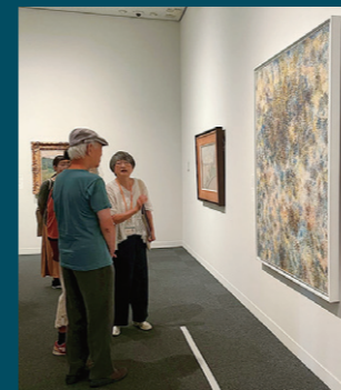
みんなで作品のイメージを伝える

みんなで会話をしながらガイドをしています。「雲」を選んだのは、抽象画ですから他の人の感想を元で動きや空間を自由に想像していただきたいと思ったからです。視覚障害者の方と鑑賞する場合には、頭の中で想像ができるように、作品の情報を視覚以外の感覚でわかりやすく伝えるようにしています。たとえば、「赤」の色の違いを表現する時は、炎のような熱い「赤」とか、暮れていく夕方の切ない優しい空気感の「赤」と表現します。今回は中途視覚障害者の方なので、記憶にある似たような色や形を例に言葉を選びました。実際の作品の色や形と、感じ取っているのとは違っているかもしれません。でも、違っていてもいいのではないのでしょうか。見えている私たちも同じ作品を観て、それぞれ違う感想を持つのですから。もっと多くの方々に、楽しんでもらいたいと思います。(ガイド Mさん)