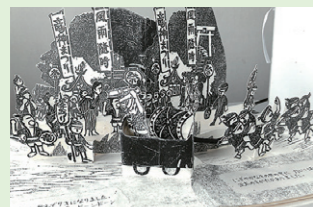
しかけ絵本「見沼のたつまき」の一場面

浦和の地で絵本づくりを続けるグループです。これまでの軌跡と心を込めた作品を展示します。個人作品の他に、見沼たんぼ周辺を舞台として木版画で仕立てた民話としかけ絵本は後世に残したい作品です。ご高覧ください。