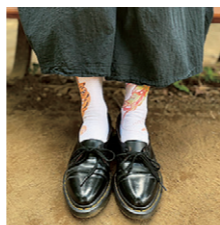
龍虎は左右で柄が違います！

ファミス通信 第54号 2025年11月発行 広報委員◆秋本圭美/安藤恭子/野口恵子/森幹枝 紙面デザイン◆木村昭司 発行者◆埼玉県立近代美術館フレンド事務局 〒330-0061 さいたま市浦和区常盤9-30-1 埼玉県立近代美術館内 tel 048(824)0111 fax 048(824)0119