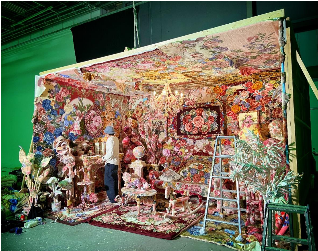
YUKI MV 設営風景 2021（参考画像）