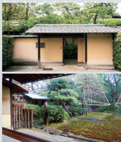
旧猪股邸 (上: 門 下: 庭園)

このツアーをきっかけに、私も本棚に埋もれていた吉田五十八の『饒舌抄』(中公文庫)という随筆集を改めて読み直し、新しく気付かされたところもありました。興味のある方は手に取っててください。風景や歴史も街歩きを楽しむのですが、建築について少しでも関心を持ちますと楽しみ方が広がってきます。それもこのツアーの目指すところでもあるのです。