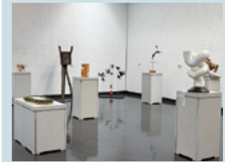
前回の会場風景 (彫刻会場)

二科埼玉支部所属作家の作品発表の場であり、同時に支部主催の公募展に応募された作品の発表です。絵画、彫刻、デザイン作品、約200点を展示する予定です。応募を歓迎します。