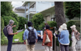
清川泰次記念ギャラリーを説明する筆者(左端)