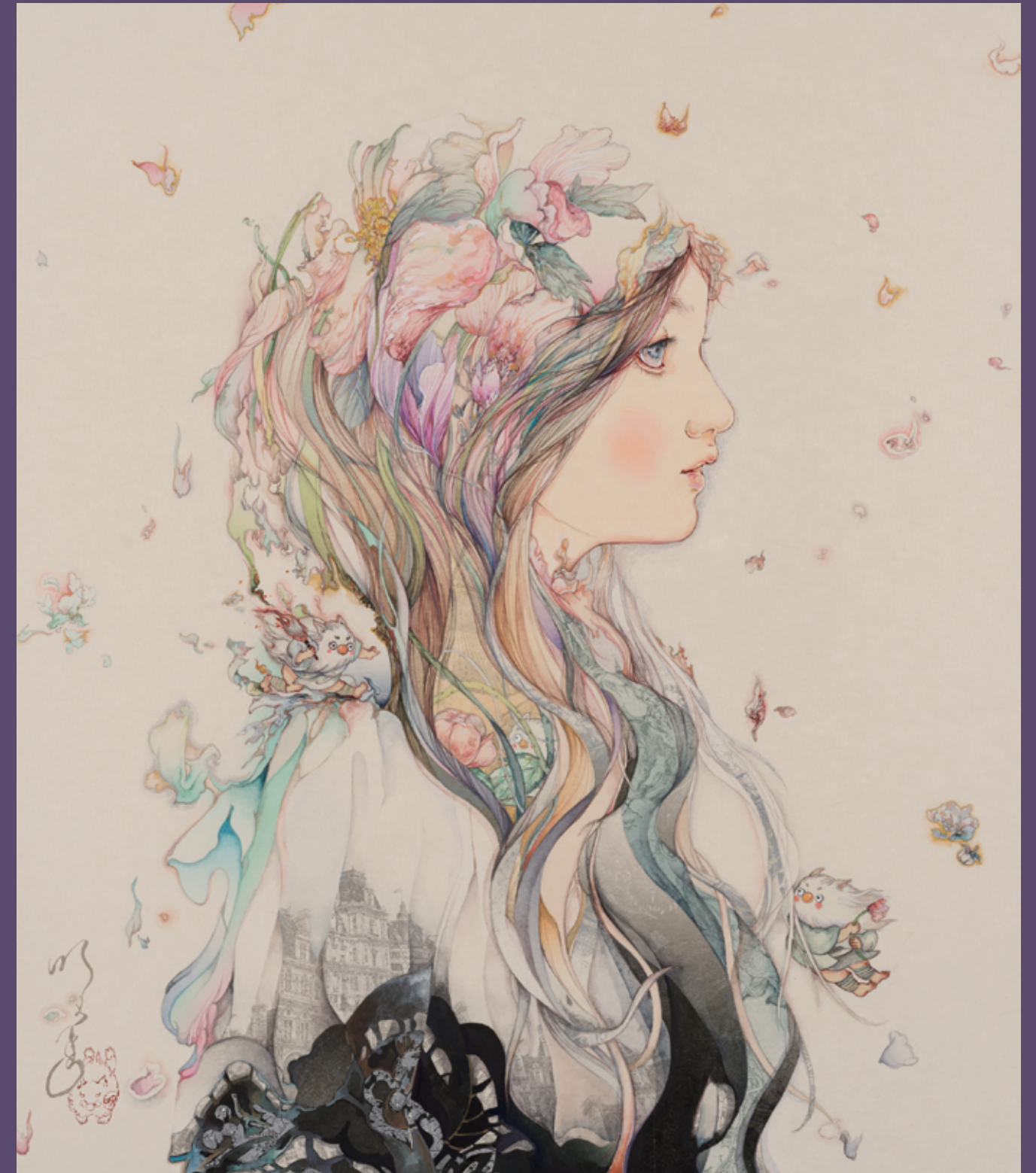
入江明日香《La saison des fleurs》(2022)