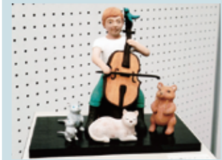
宮沢賢治「セロ弾きのゴーシュ」より

「生きとし生けるものへの讃歌」宮沢賢治の童話の世界を中心に、木彫、陶彫、創作人形で表現。他に、祈りの造形、人と動物たちとの共生の姿を、約40点、展示致します。どうぞ楽しいひとときを、お過ごし下さい。