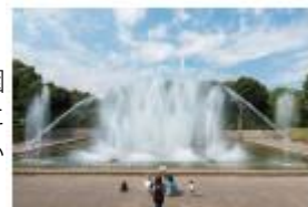
北浦和公園の音楽噴水

また、公園内には音楽噴水もあり、自然とアートを満喫できるスポットとなっています。