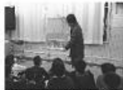
「日本画って何だろう」授業の様子