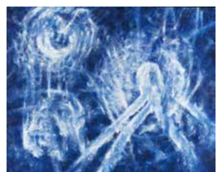
① 長沢秀之《風景―曖昧な存在》1992年 油彩・カンヴァス

当館は1970年代美術に特に力を入れて収集してきましたが、沢居曜子(1949-)の《Line-Work VI-78-21》シリーズのドローイング7点(図版②)は、多くの作家がコンセプチュアルな作品の制作に取り組んだこの時代を代表する重要な作品です。