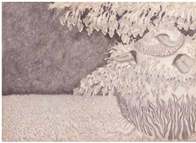
上村次敏《無題》1959年頃

もうひとつの世界なのか、それとも現実なのか。異界/異形と芸術表現の関係を探ります。