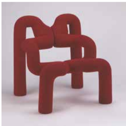
テルイエ・エクストレム 《エクストレム》 デザイン：1972-77年 製品化：1984年