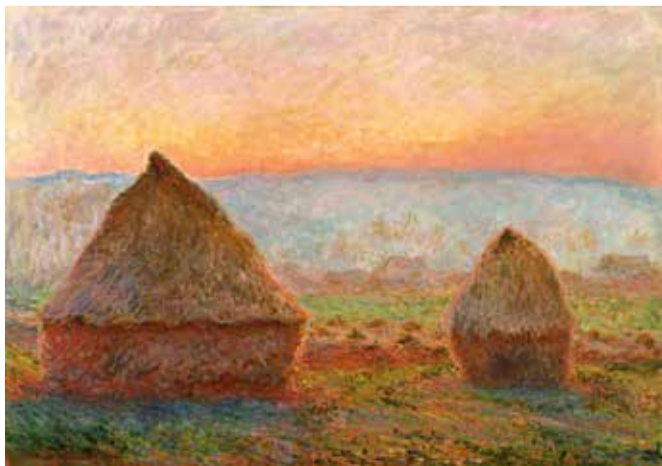
クロード・モネ《ジヴェルニーの積みわら、夕日》1888-89年

ジョルジュ・ルオー《横向きのピエロ》ほか、MOMAS コレクションの名品を紹介いたします。