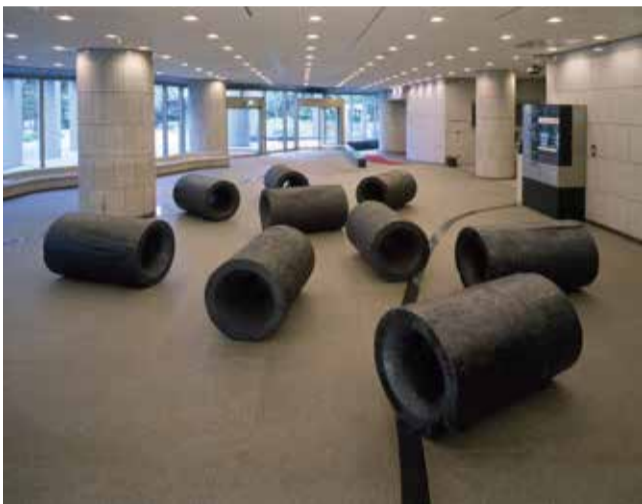
遠藤利克《泉-9個からなる》1989年