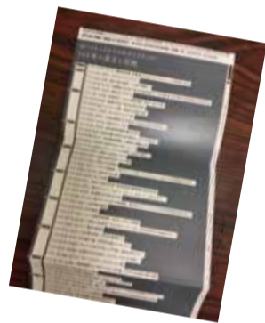
2017.4.1-2018.3.31 MUSEUM CALENDER裏面のZOCALONG=ソカロング。1982年から2017年までの埼玉県立近代美術館の歴史が詰まっており、90cm近くあります。

「開館30周年記念展 日本の70年代1968-1982」「みんなで選ぶMOMASコレクションベスト10」