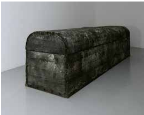
遠藤利克《寓話V-鉛の壺》2016年 作家蔵

【スライドトーク】ご希望のグループにスライドを使って見どころをご案内します(予約制)。お問い合わせ・ご予約は教育・広報担当(電話048-824-0110)まで。