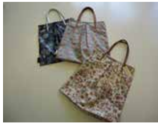
エアリータックバッグ 各2,800円(税別)

ショップからご紹介するのは、エアリータックバッグです。名前にもあるように空気のような軽さが魅力です。A4のノートやファイルもすっぽり入る大きさで、タックのついたデザインは、お財布やポーチなど幅のある物を入れてもきれいに納まります。ポリウレタンコーティング加工で汚れのつきにくい素材なので安心です。(M.N.)