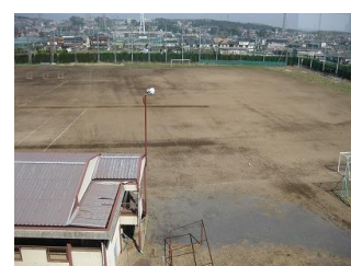
運動部部室とグラウンド