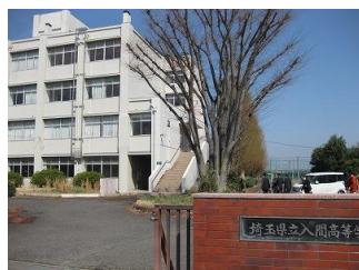
旧校舎とケヤキの木

開設準備室では、旧入間高等学校の改修等工事が始まる前に現地調査をしてきました。校門を入ると、大きなケヤキの木がそびえ立ち、これまで入間高等学校と一緒に歩んできた歴史を感じさせます。このケヤキは、今後も新校のシンボルツリーとして新たな歴史を刻んでいくことでしょう。